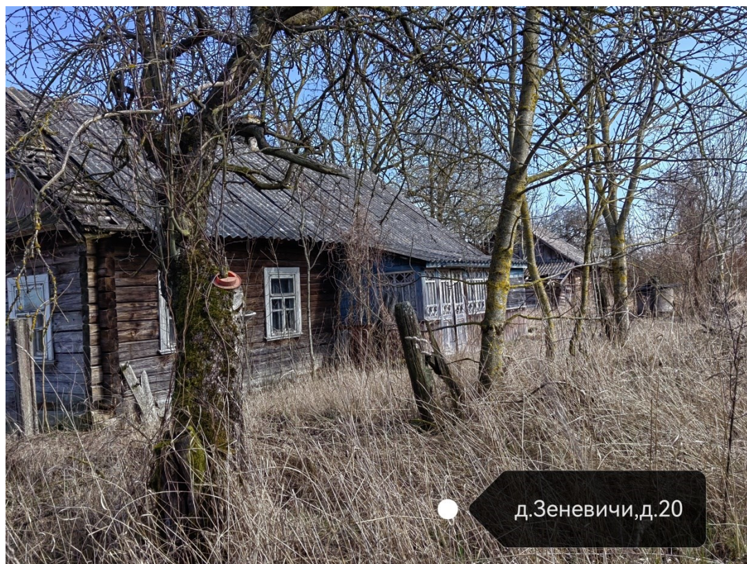
д. Зеневичи, д. 20