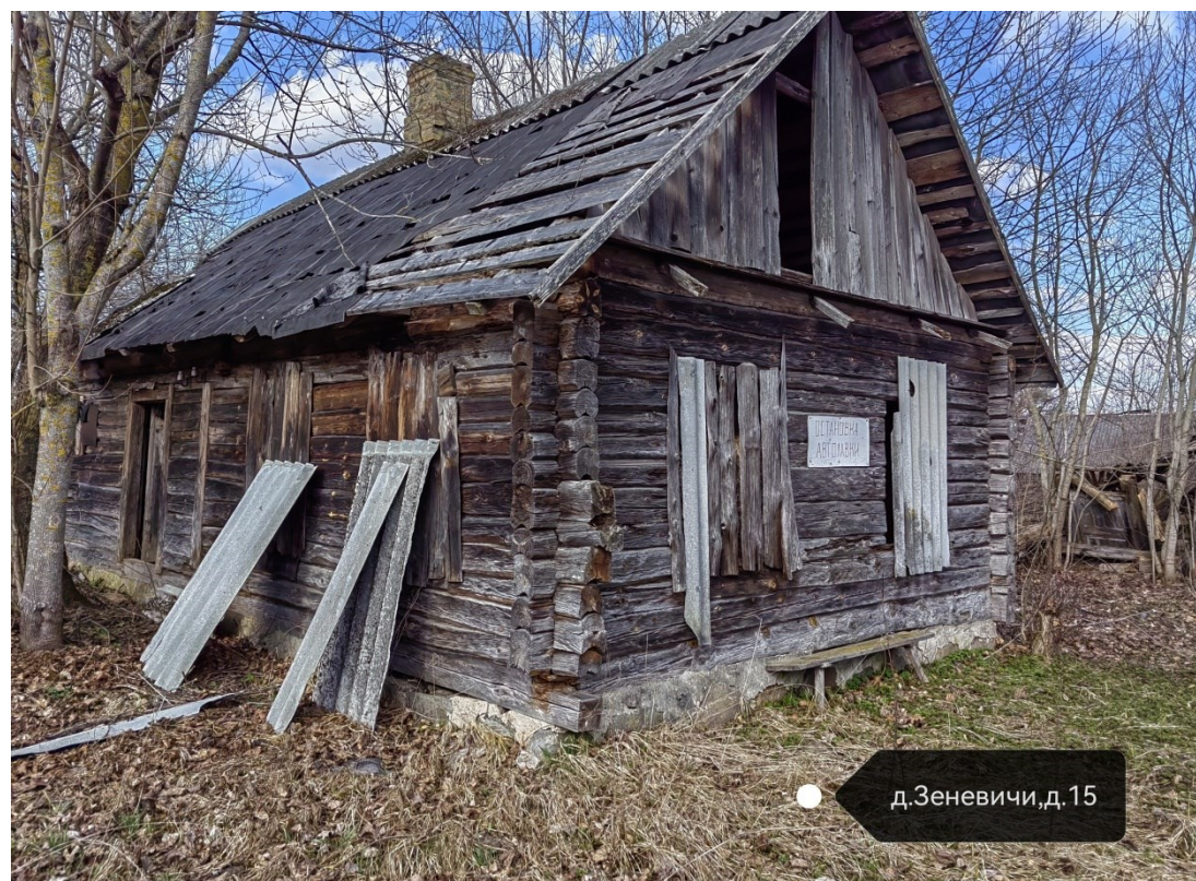
д. Зеневичи, д. 15