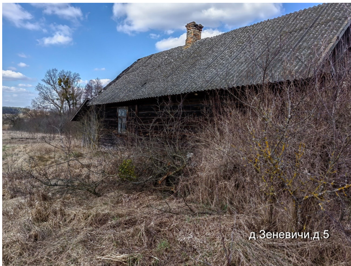
д. Зеневичи, д. 5